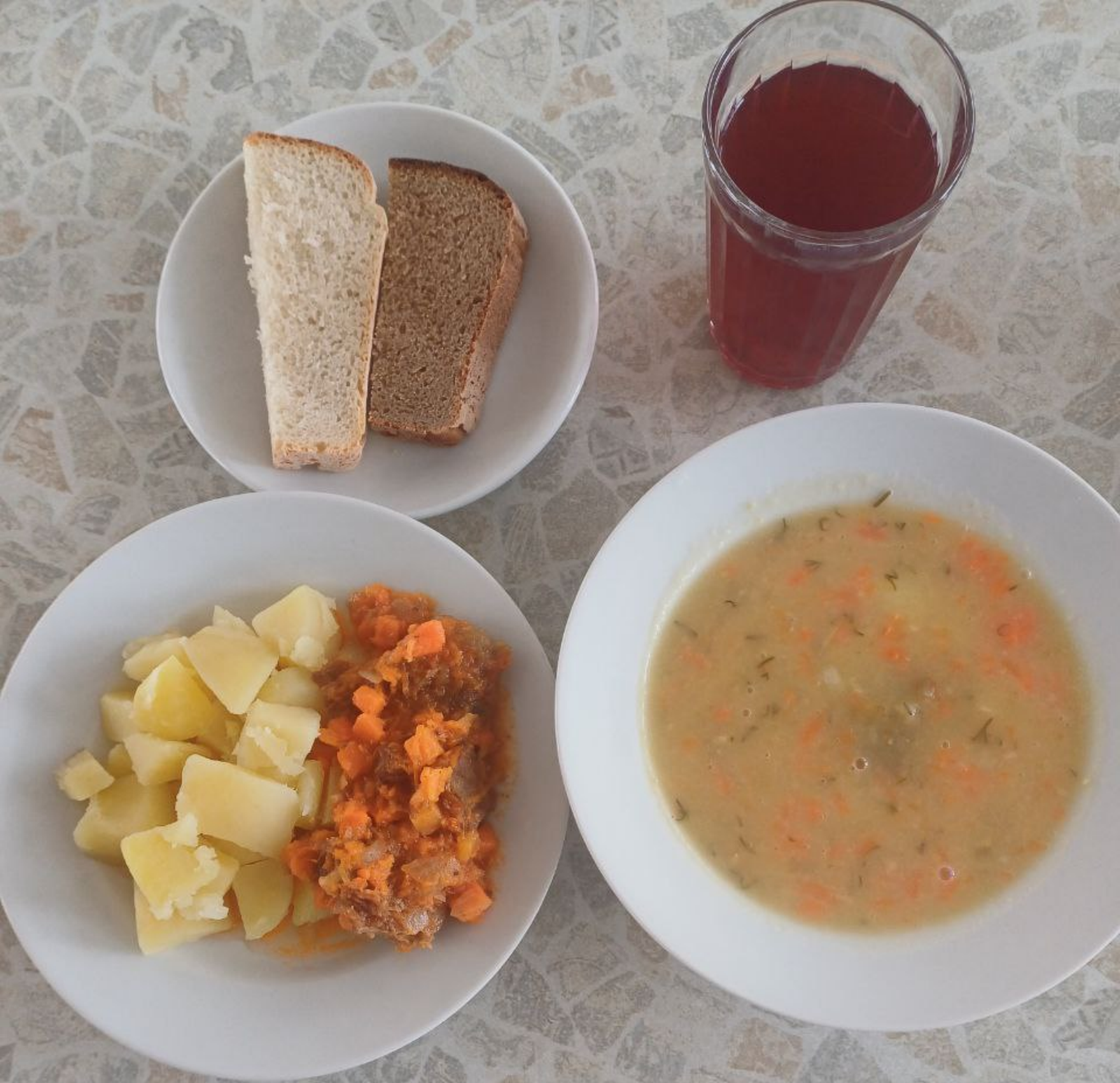
Обед для учащихся льготной категории