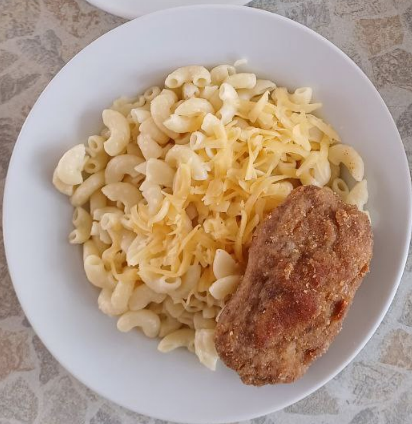
Завтрак (полдник) для учащихся льготной категории