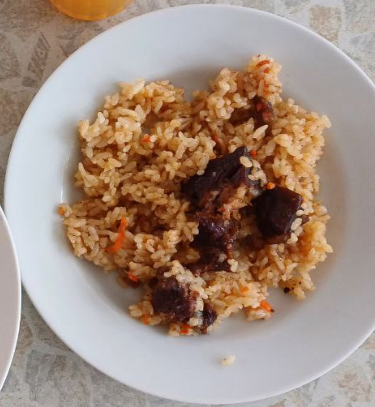
Обед для учащихся льготной категории (сахарный диабет)