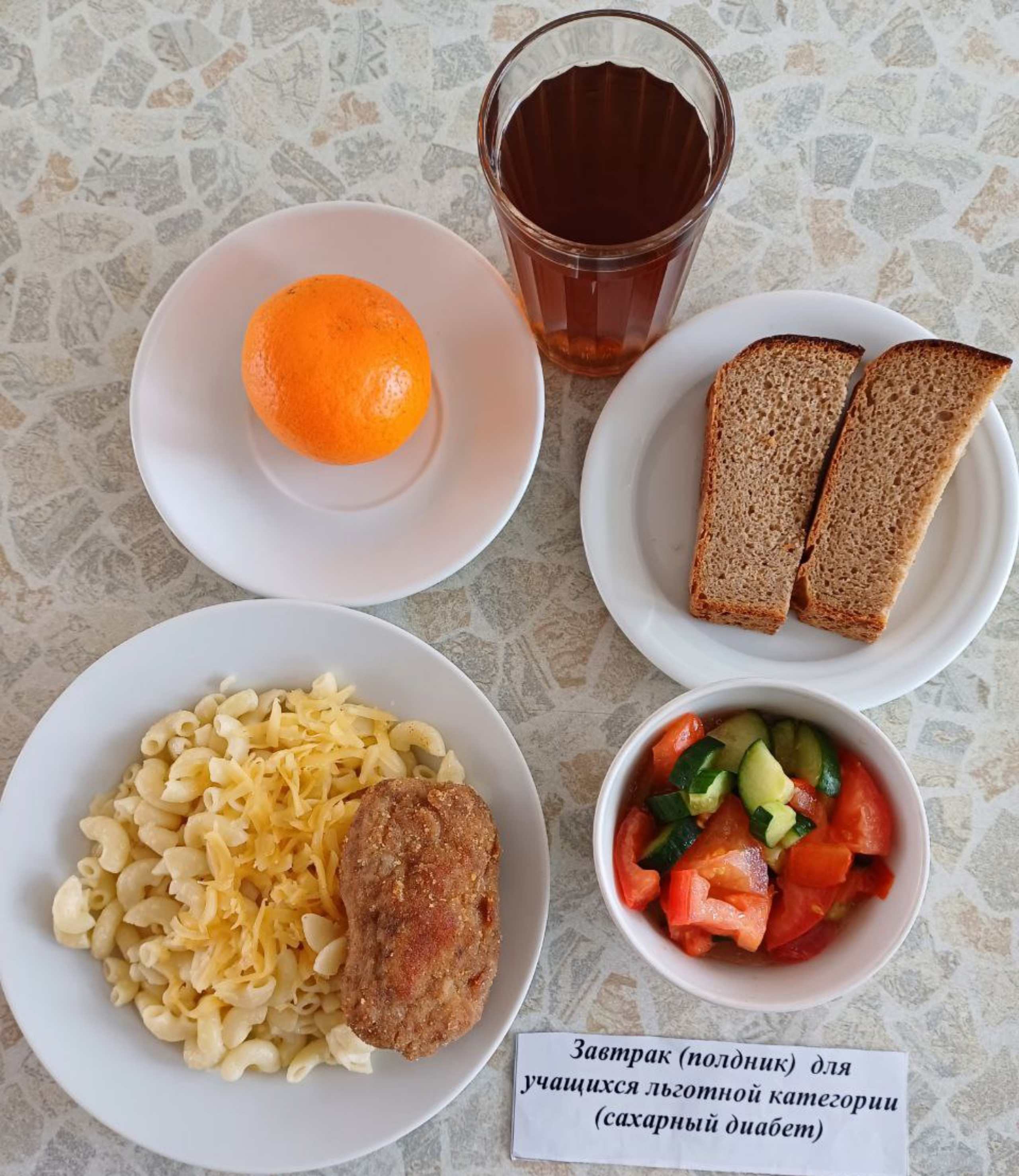
Завтрак (полдник) для учащихся льготной категории (сахарный диабет)