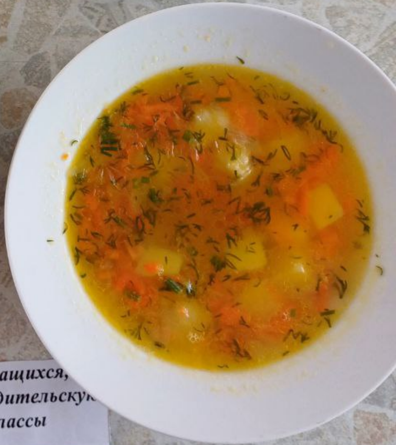
Полдник для учащихся, питающихся за родительскую плату 5-11 классы