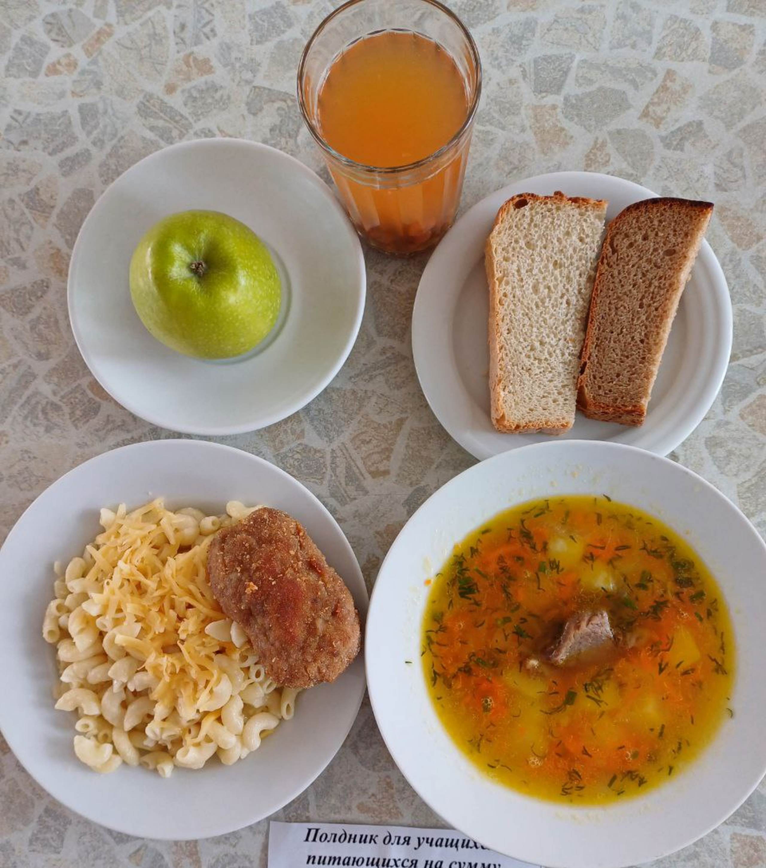
Полдник для учащихся питающихся на сумму дотационных выплат 1 – 4 классы (2 смена)