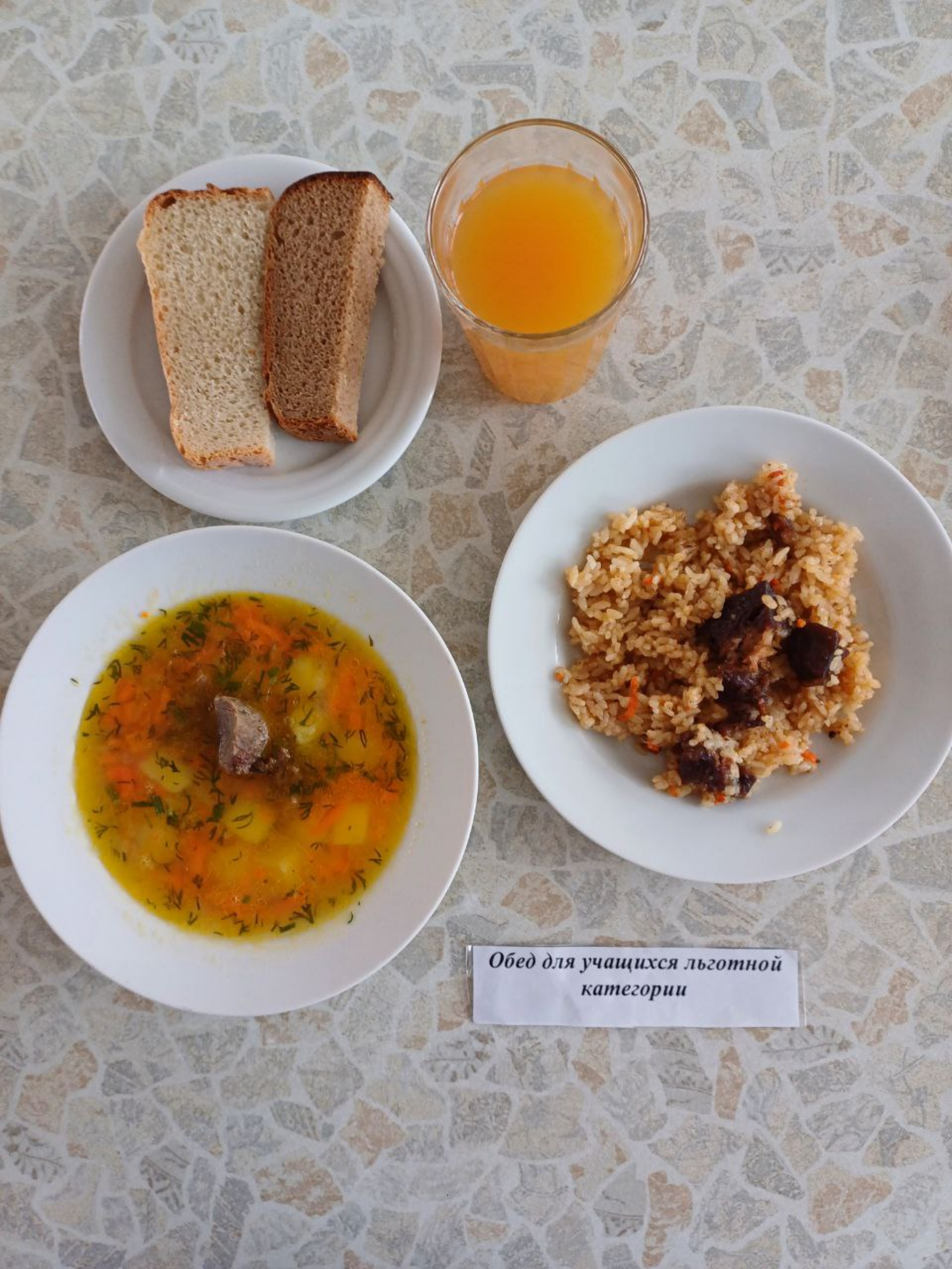
Обед для учащихся льготной категории