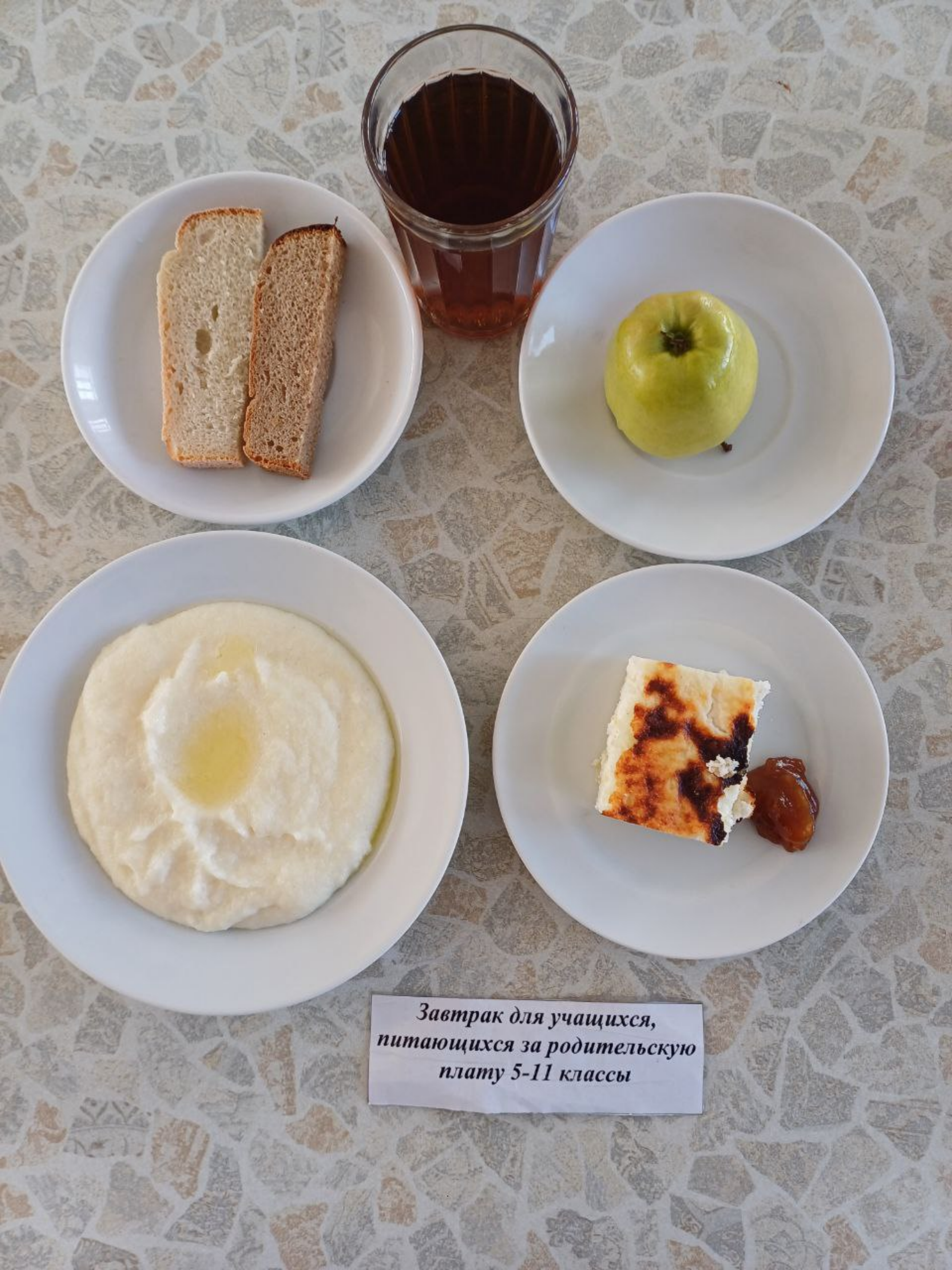
Завтрак для учащихся, питающихся за родительскую плату 5-11 классы