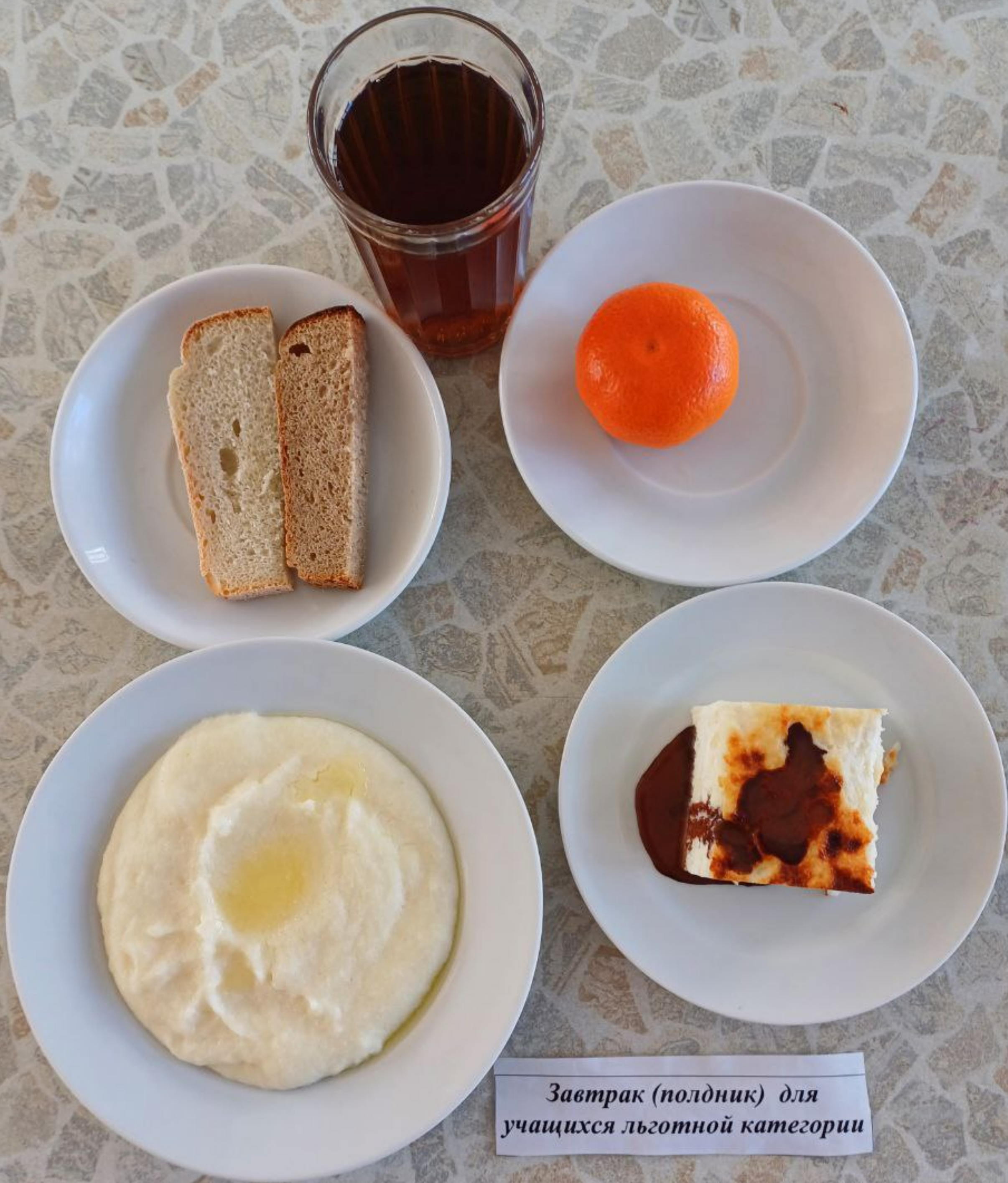
Завтрак (полдник) для учащихся льготной категории