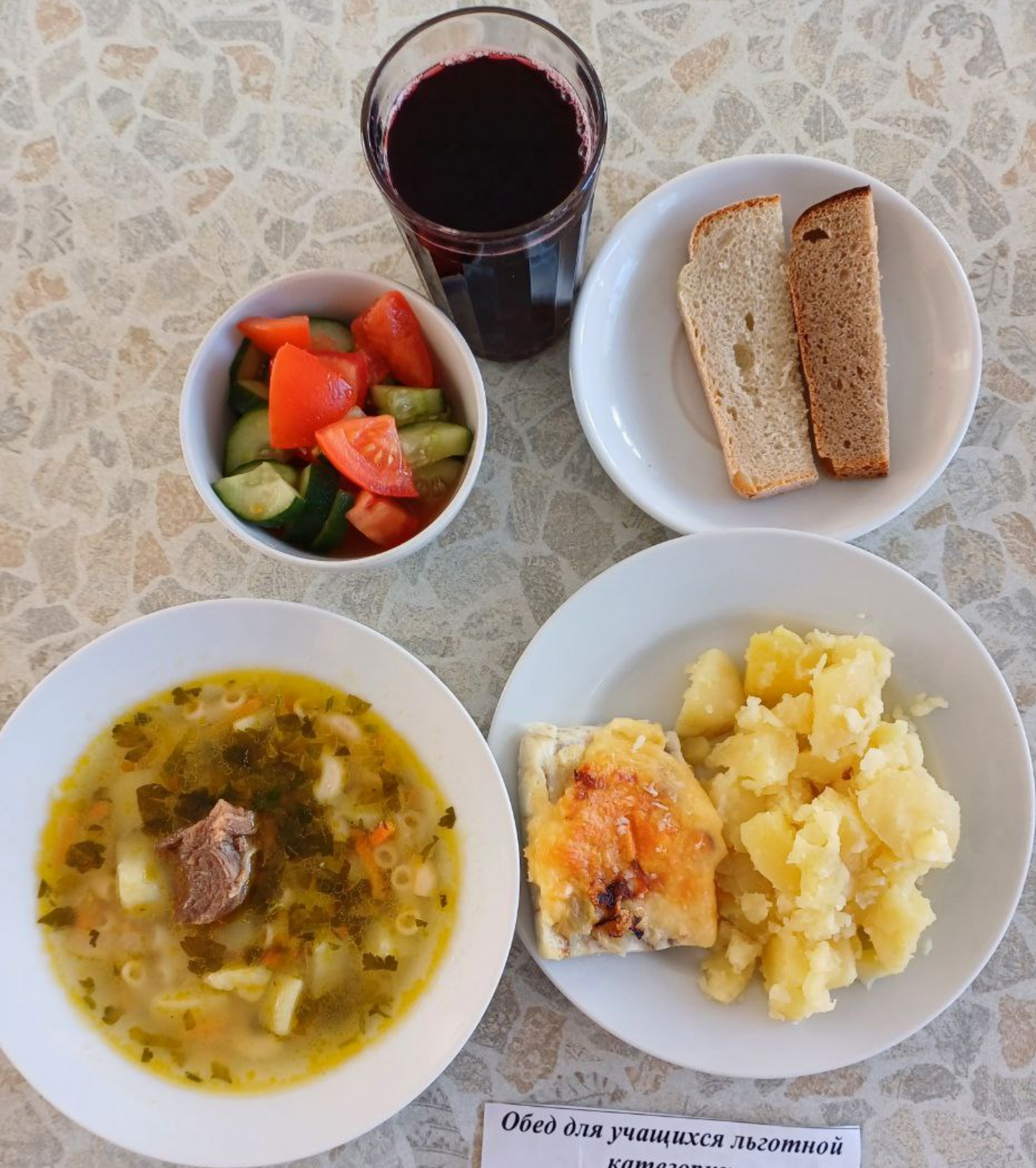
Обед для учащихся льготной категории