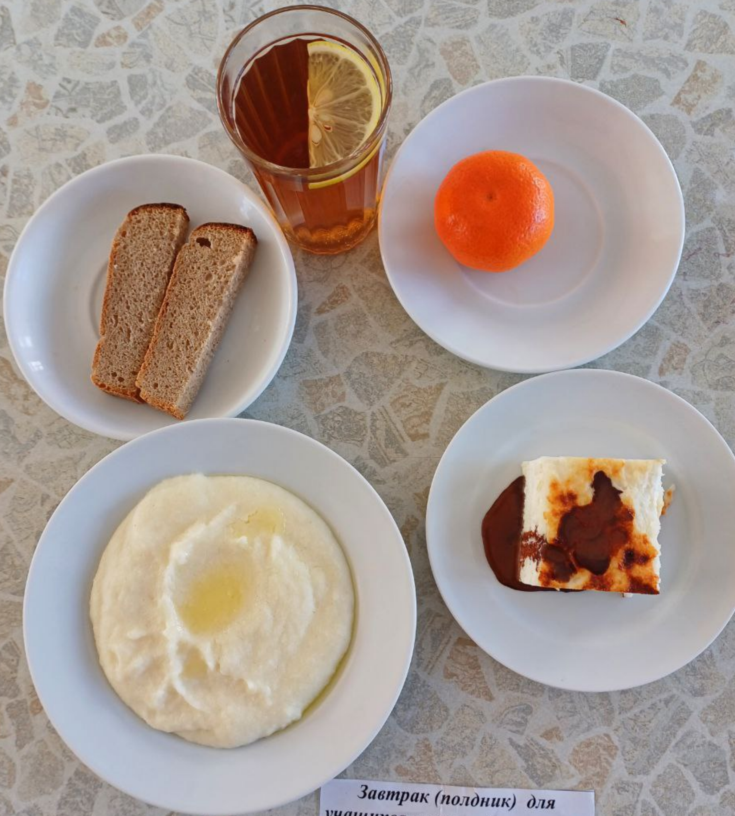
Завтрак (полдник) для учащихся льготной категории (сахарный диабет)