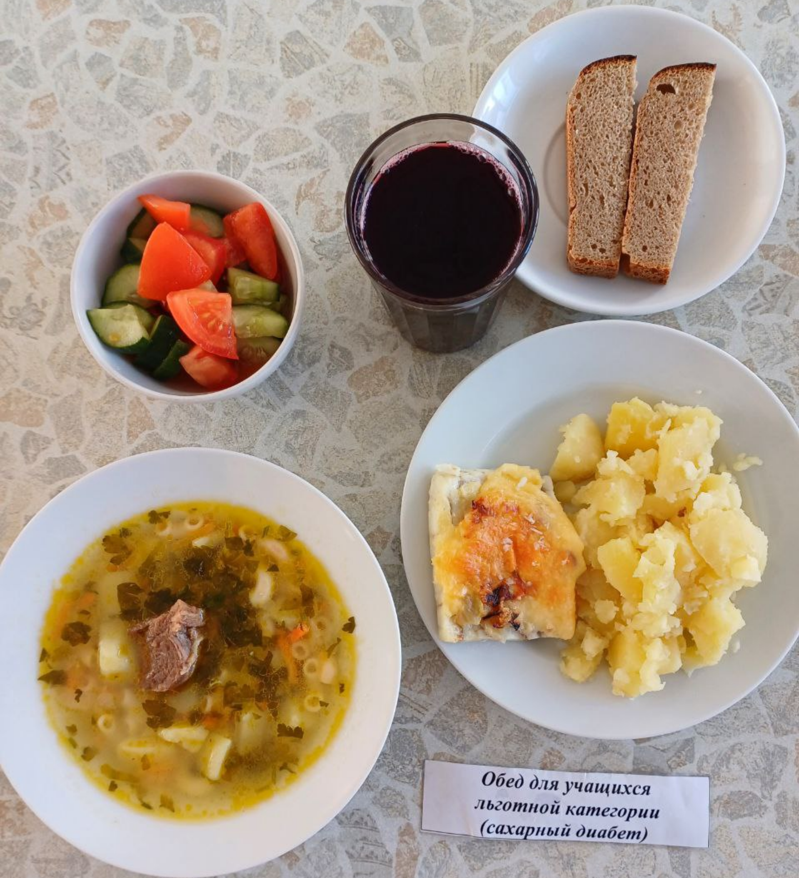
Обед для учащихся льготной категории (сахарный диабет)