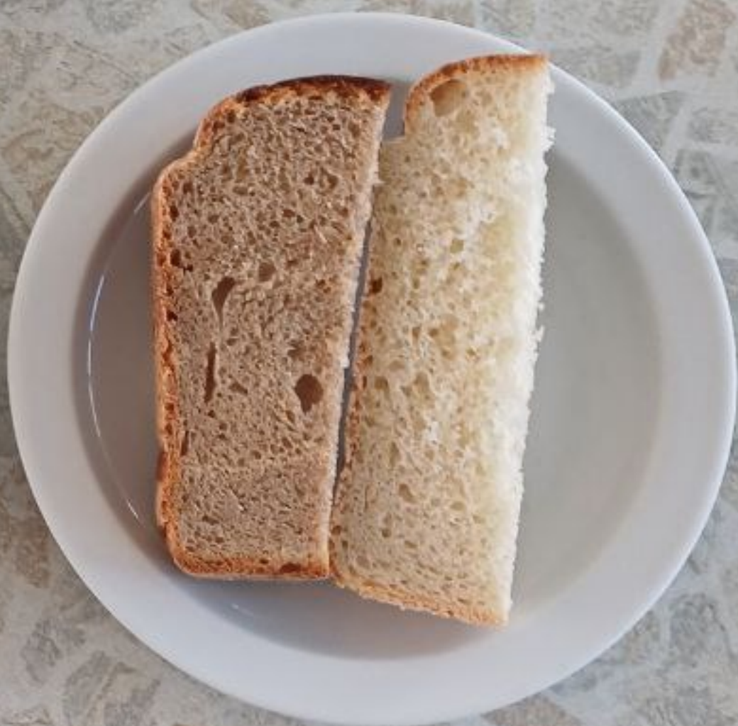
Завтрак для учащихся, питающихся на сумму дотационных выплат 1 – 4 классы (1 смена)