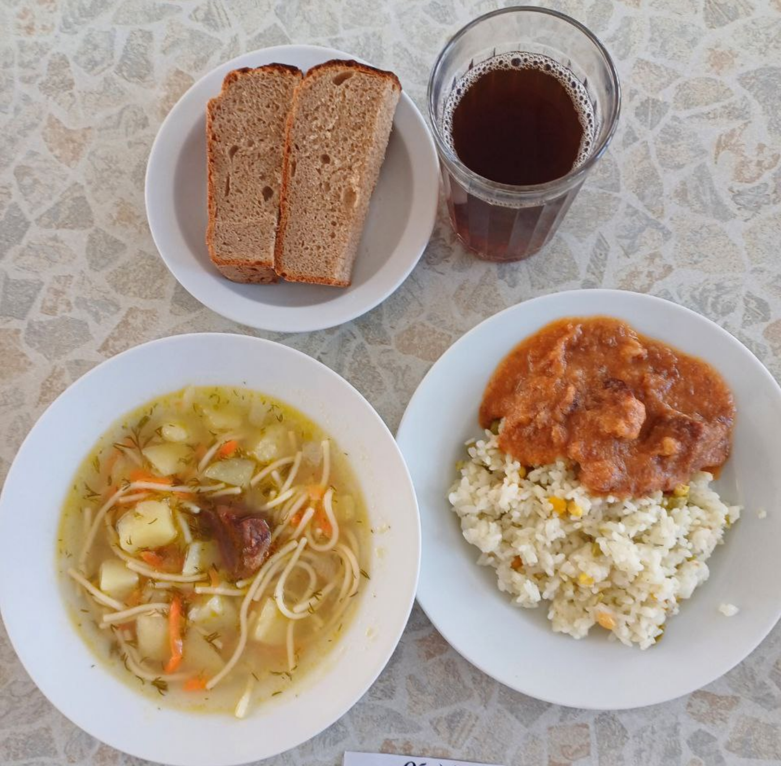
Обед для учащихся льготной категории (сахарный диабет)