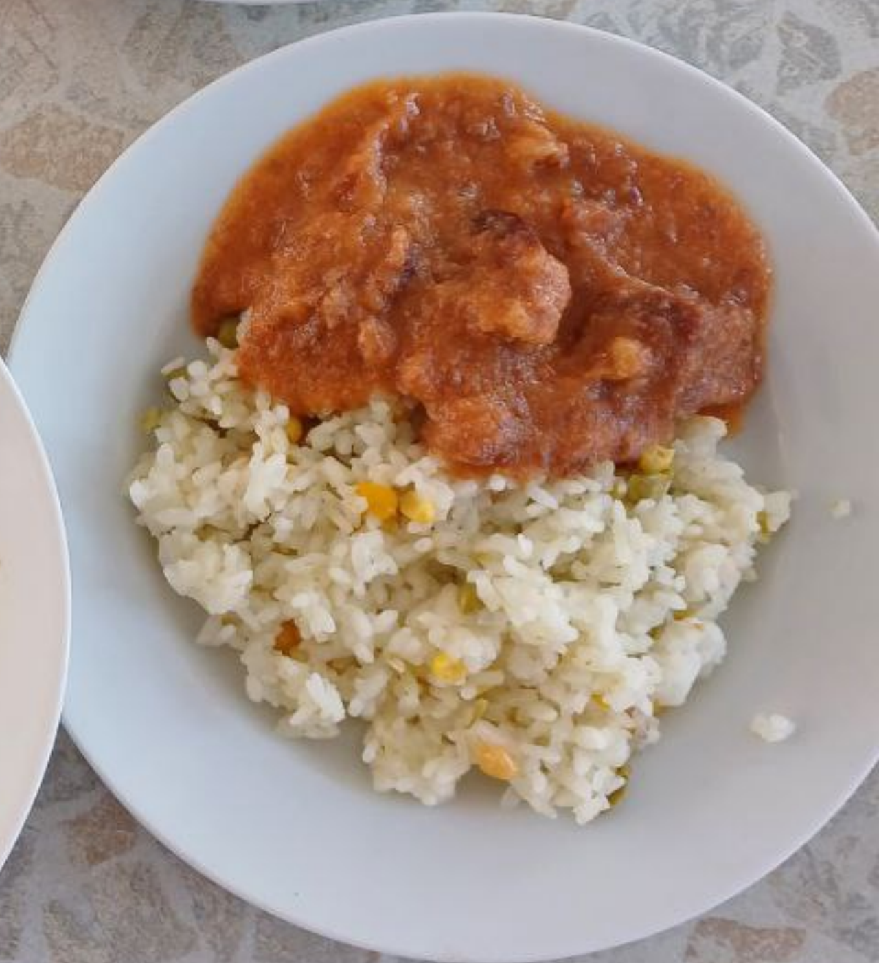
Обед для учащихся льготной категории